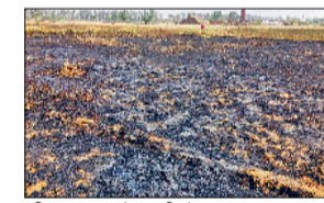
जौड़। आग से जली गेहूं।

आग की सूचना पाकर सफेदी त्था पिल्लूखेड़ा से दो फायरब्रिगेड की गाड़ियां मौके पर पहुंच गईं और ग्रामीणों के सहयोग से आग पर काबू पाया लेकिन तब तक आधा दर्जन से ज्यादा किसानों की 11 एकड़ खड़ी गेहूं फसल तथा दो एकड़ फाने जलकर राख हो चुके थे। गांव बागडू कलां खेतों में बुधवार दोपहर को अचानक आग भड़क उठी। मौके पर मौजूद किसानों ने आग पर काबू पाने