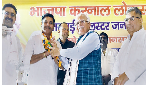
करनाल। भाजपा में शामिल होने पर जोगिंद्र कुक्कू का स्वागत करते पूर्व मुख्यमंत्री मनोहर लाल खट्टर।

इनेलो के शहरी अध्यक्ष रहे जोगिंद्र कुक्कू ने पार्टी की नीतियों से प्रभावित होकर भारतीय जनता पार्टी में आस्था जाहिर की। वह भाजपा के वरिष्ठ नेता एवं पूर्व विधायक भगवानदास कबीरपंथी के नेतृत्व में आयोजित हुई कल्सटर जनसभा के दौरान भाजपा में शामिल हुए। भाजपा में शामिल होने पर हरियाणा के पूर्व मुख्यमंत्री व करनाल लोकसभा प्रत्याशी मनोहर लाल खट्टर ने उनकी पीठ थपथपाई। पूर्व मुख्यमंत्री मनोहर लाल खट्टर ने जोगिंद्र सिंह कुक्कू