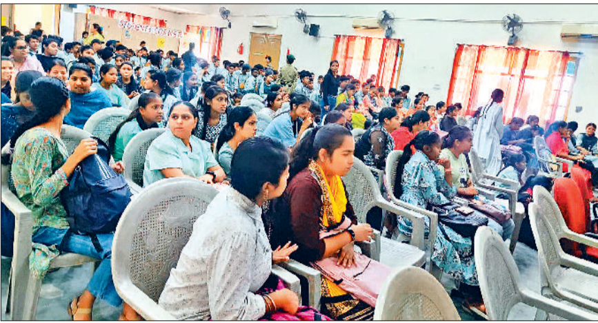
अंबाला। सेमीनार में मौजूद छात्रों को संबोधित करते हुए कार्यवाहक प्रिंसिपल।