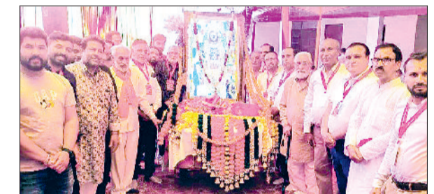
पानीपत। श्री राम सेवा दल के पदाधिकारी श्री रामनवमी महोत्सव में भाग लेते श्रद्धालुगण।